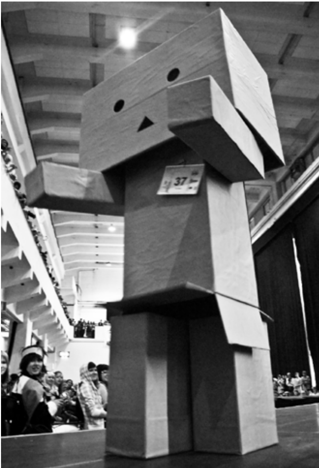
Dambo - pahlavakokkorobotti sarjasta Yotsuba&

Tänään pidettiin Merikaapelihallissa cosplay-yksilökilpailu, nykyään yksi suosituimmista ohjelmanumeroista. Kategorioita oli kaksi ja kummatkin kategoriasta palkittiin kolme parasta, minkä lisäksi Egmont antoi vielä kahdelle kunniamaininnan. Osallistujia oli noin kuusikymmentä. Merikaapelihalli oli niin täynnä yleisöä, että järjestyksenvalvojille tuli kiire passittaa seisovat katsojat tietyn rajan taakse, jotta kilpailijat mahtuisivat kävelemään pois lavalta. Yleisö tuli myös lavalle tanssimaan tuloksia odotellessaan.